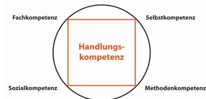
Abb. 2: Berufliche Handlungskompetenz